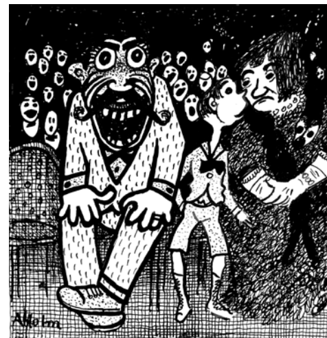
Införd 1936 i nr. 9 Konsument- bladet